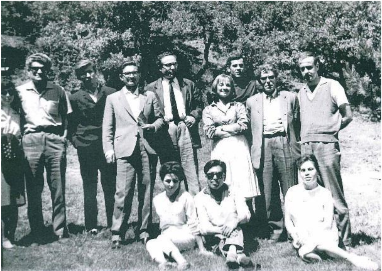
Hasan Hüseyin Korkmazgil'in Arif Nihat Asya'nın Öğrencisiyken Aldığı Notların Çizelgesi